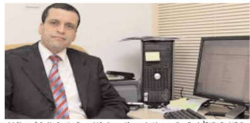
مختار مصيطفى، وزير التعليم العالي والبحث العلمي يكشف عن استراتيجية جديدة لمواجهة الأزمة النفطية من خلال تطوير الموارد البشرية.

أكد كاتب الدولة الأسبق للاستشارات والإحصائيات، بشير مصيطفى، في محاضرة متنوعة يناقش خلالها أهمية تنمية الموارد البشرية في مواجهة الأزمة النفطية، بأن الاستثمار في التعليم والتدريب المهني من شأنه أن يخلق فرص عمل جديدة.